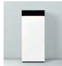
Vitodens 222-F Typ B2TF