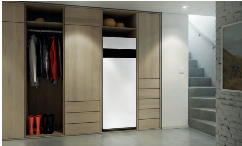
Vitodens 222-F mit attraktivem Design in der Farbe Vitoppearlwhite

Platzsparende, bodenstehende Gas-Brennwert-Kompaktgeräte mit hohem Warmwasserkomfort für unterschiedliche Wasserqualitäten