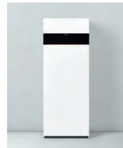
Vitodens 222-F Typ B2SF